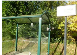
19 : abribus rue des Noisetiers