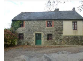
9 : maison de « Jean-Louis »