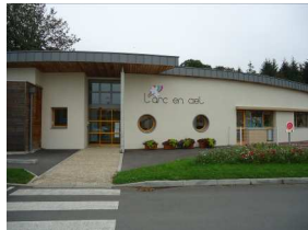
6 : l'Arc en ciel