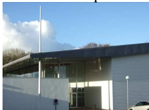
1 : salle de sports