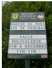
2 : panneau d'informations