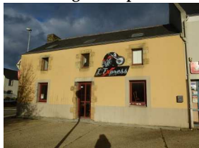
5 : enseigne l'Express Café