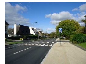
13 : ralentisseur à Keranna