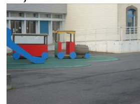
16 : jeux de la cour de l'école