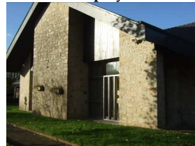
12 : salle polyvalente