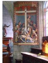
11 : descente de croix à l'église