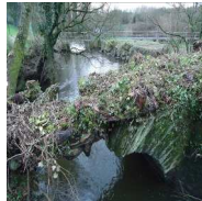
10 : pont en ruine sur l'Elorn à Kerhamon