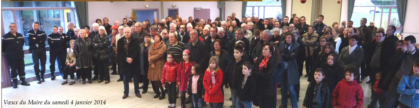
Vœux du Maire du samedi 4 janvier 2014