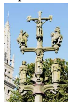
7 : calvaire place des 9 Chênes