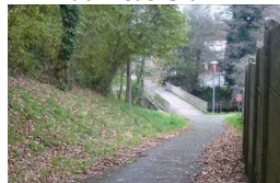
17 : allée et passerelle sur l'Elorn au Voas Glaz