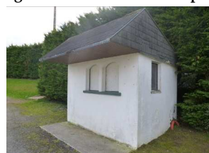
4 : guérite entrée terrain de sports