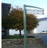
18 : panneau indicateur près de la mairie