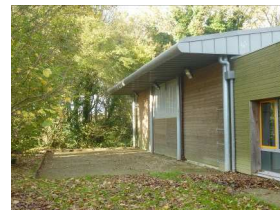
8 : boulodrome