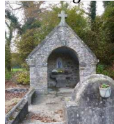
15 : oratoire - Fontaine de la Vierge