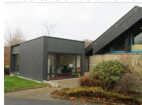
14 : extension de la mairie